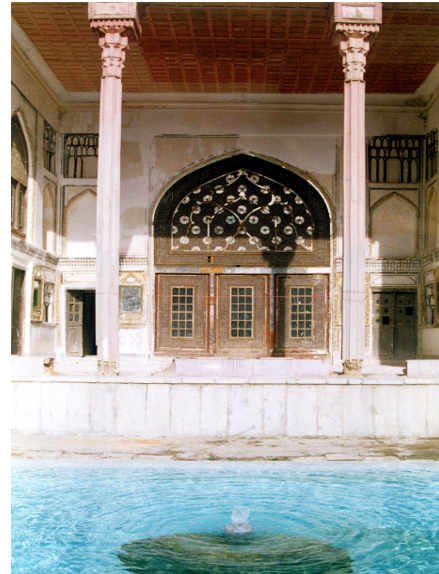
عمارت آصف (سنندج)