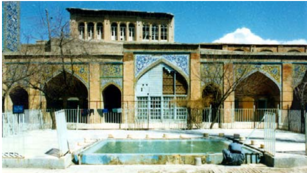
مسجد جامع سنندج