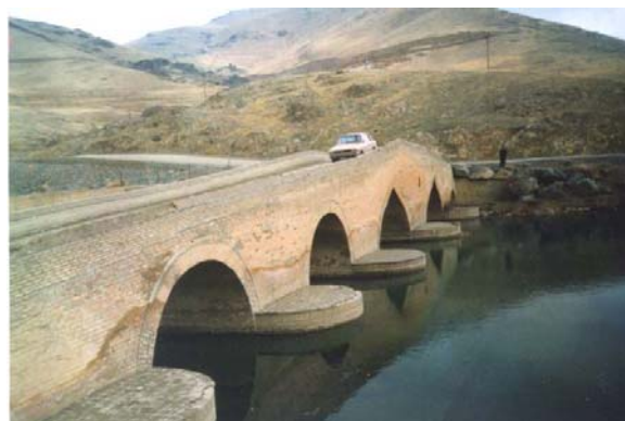
پل شیخ (سنندج)