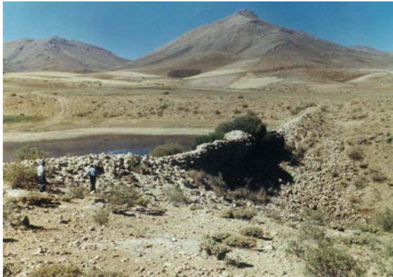
بند امیرنظام (بیجار)