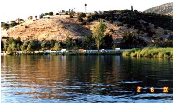
دریاچه زیوار (مریوان)