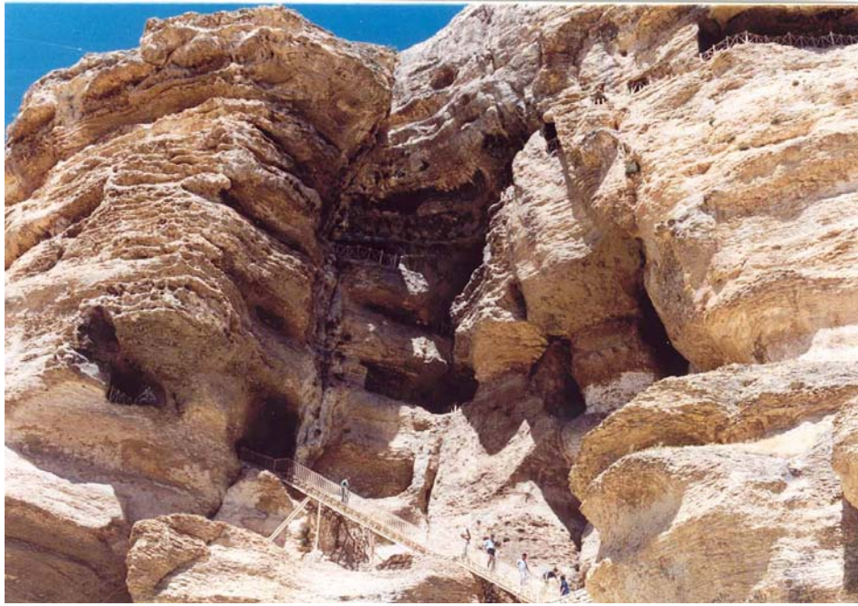
غار کرفتو (دیواندره)