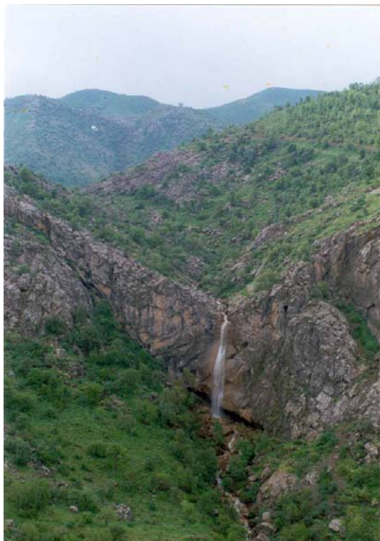
آبشار کویله (مریوان)

و هم‌چنین استان دارای چشمه‌های متعدد و چشمه‌سارهای زیبایی است که بیشتر آنها دارای خواص طبی می‌باشند که می‌توان به دریاچه زریوار و آبشارهای کویله و بل در مریوان، چشمه‌های چهل چشمه در دیواندره، و باباگرگ و سراب وینسار و سراب در قروه، چشمه سراب در بیجار، و گواز در کامیاران و خاورآباد و قم‌چقay و هفت آسیاب و آب تلخ (بیر صالح) در بیجار اشاره کرد.