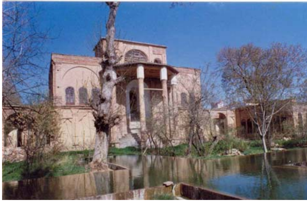
عمارت خسروآباد (سنندج)