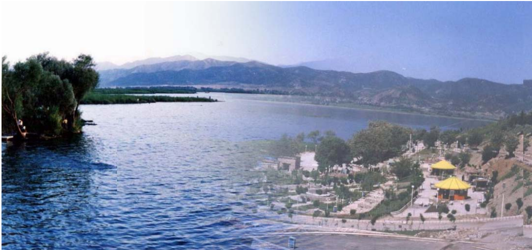
دریاچه زریوار (مریوان)