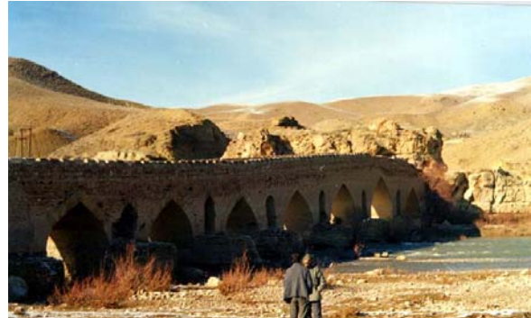
پل قزل اوزن (بیجار)