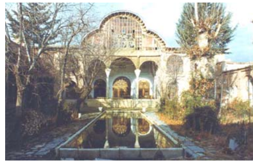
عمارت مشیر دیوان (سنندج)