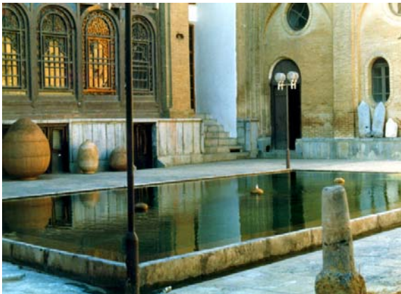
موزه سنندج (عمارت حبیبی)