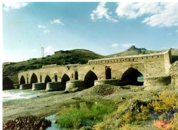
پل قشلاق (سنندج)