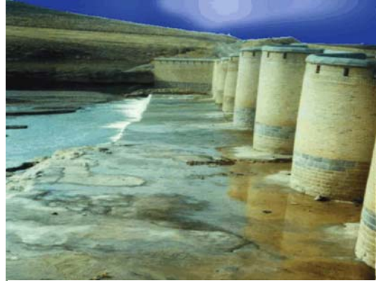
پل فرهادآباد (بیجار)