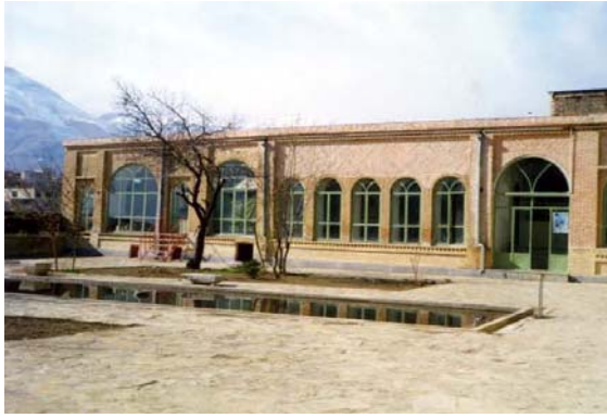
عمارت حبیبی (موزه سنندج)